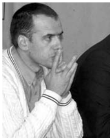
MONTEVIDEO (2040) El Profesor Yamandú Orsi, y otras 7.809 personas más, serán investigadas penalmente, por

apología del delito. Fueron denunciados por haber "confesado" en una página web que todos y cada uno de ellos, contribuyó con algún aborto en algún momento. Consultado el Secretario Orsi por El Corresponsal, confirmó que puso allí su firma.