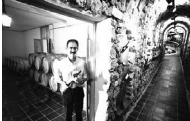
Cruz de Tenerife y la cámara de Comercio Uruguay-Canarias"